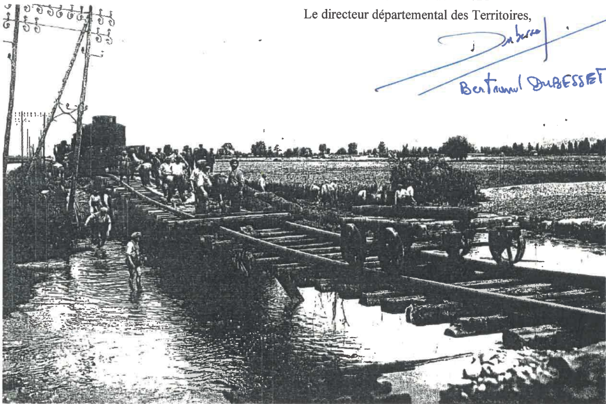
Crue des 16 et 17 juin 1930 du Courgoux